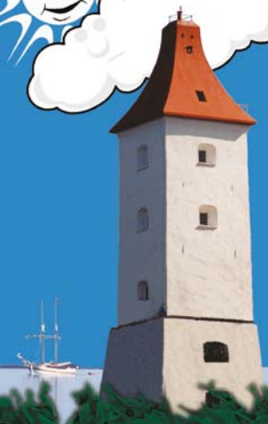
• Tryck: Östkustens Tryckeri AB